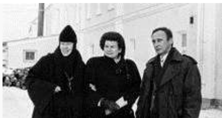
В благотворительной поездке по Ярославской области