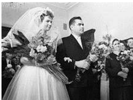
Торжественная церемония бракосочетания летчиков-космонавтов Валентины Терешковой и Андрияна Николаева. Москва, 3 ноября 1963