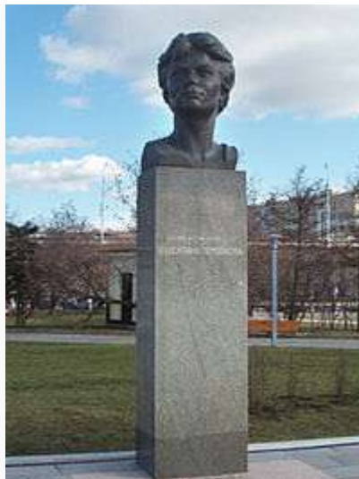
Памятник Валентине Терешковой на аллее Космонавтов в Москве