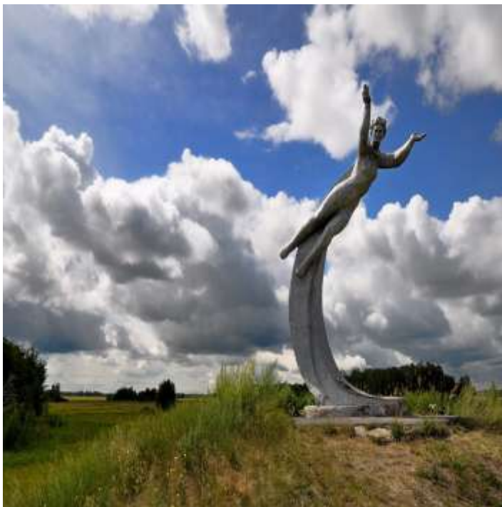
Памятник В.В. Терешковой на месте ее приземления