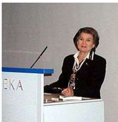
Валентина Терешкова во время визита в Финляндию . 2002 год